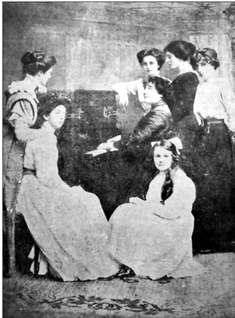
Η ώρα του κλειδοκύμβαλου, ένα χειμωνιάτικο απόγευμα.

χυμόν εξ πορτοκαλίων, το δε φθινόπωρον εν μικρόν ποτήριον χυμού νωπών σταφυλών.