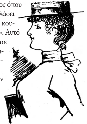
Σεμνή και ενάρετη Ατθίδα, κοινωνικά πιστοποιημένη.

Όπως βέβαια αντιλαμβάνεται ο αναγνώστης, τα πράγματα ήταν πολύ δύσκολα για τους νέους της εποχής. Τα αγόρια βρίσκονταν σε φοβερό δίλημμα: ή να παντρευτούν μικρά όπως όπως ή να κοιτάζουν από μακριά το σπάνιο κι απαγορευμένο καρπό. Τα κορίτσια παντρεύονταν σε μικρή ηλικία, ιδιαίτερα αν ο πατέρας ή ο μεγάλος αδερφός έκριναν ότι είναι ζωηρά κι ανήσυχα, και φυσικά τα συνοικέσια έδιναν κι έπαιρναν.