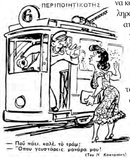
— Πού πάει, καλέ, τὸ τράμ; — Ὅπου γουστάρεις, μανάρα μου! (Του Ν. Κασταρέη)

να κοιτάξει κάπως ερωτιάρικα μια όμορφη δεσποινίδα στο Φάληρο. Ίσως δε να της πέταξε και κάποιο γλυκόλογο. Τρέμοντας από θυμό, ο πατέρας της μικρής δεν περιορίστηκε μονάχα στο να βάλει αμέσως στη θέση του τον «κορτάκια», αλλά έγραψε ο αθεόφοβος τρισέλιδη αναφορά στον Υπουργό Εξωτερικών, όπου φυσικά όλη η «ανοίκειος συμπεριφορά» του υπαλλήλου και τα «έκτροπα» που δημιούργησε εξιστορούνταν με κάθε λεπτομέρεια και δραματικότατο τόνο. Ο υπουργός ασχολήθηκε αμέσως με την απρεπή κι ανάρμοστη συμπεριφορά του νεαρού υπαλλήλου του και τον κάλεσε σε γραπτή απολογία! Ακόμη σώζεται στο Υπουργείο Εξωτερικών η απολογία του άτυχου νεαρού: «Ητένιζον την Δεσποινίδα, ουχί όμως ερωτικώς και με ασεβή προδιάθεσιν αλλ' απλώς και μόνον προς θεαματιμόν»!