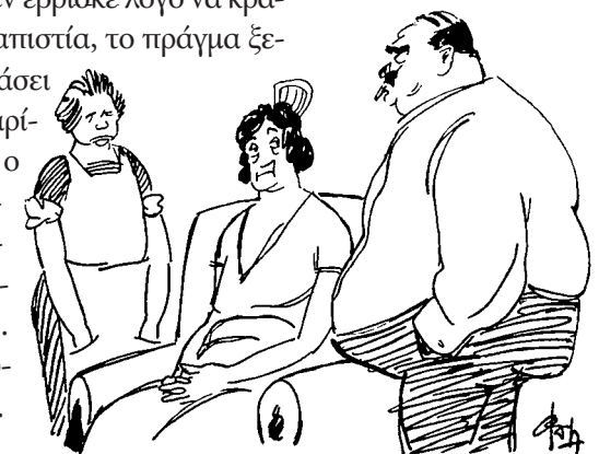
Ο κύριος.— Τι έχει πάλιν αυτή; Η κυρία.— Λέγει, πώς δεν της φέρσαι κλά, πώς της μιλάς όπως μιλάς σ'έμένα!

Ο Άνδρας θεωρούνταν πρόσωπο αξιοσέβαστο, με μεγάλη προσωπικότητα, αρχηγός της οικογένειας, «αφέντης με τα ούλα του». Ό,τι έλεγε ήταν