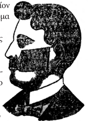
Αυτός είναι ο περίφημος μουστακοδέτης!

Β. Αττικού, Εύθυμα διηγήματα της Παλιάς Αθήνας , τόμος Β'