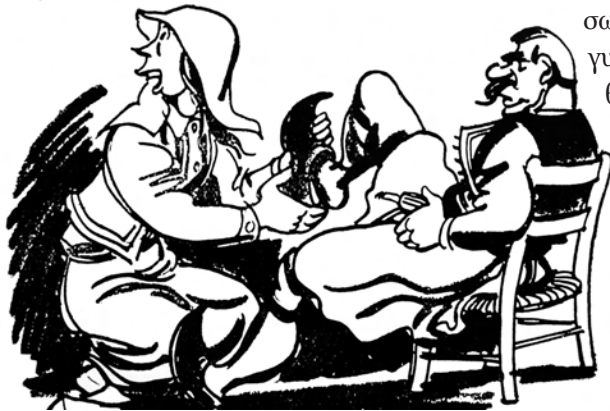
Το πλούσιο των ποδιών του «Αφέντη» από τη γυναίκα του – αναμφισβήτητο σημάδι συζυγικής τρυφερότητας.

σωστό και ακολουθούσε η επιβεβαίωση της γυναίκας του: «Ναι, κυρ Μανώλη μου, όπως θέλεις, Αφέντη μου». Αντίθετη γνώμη θεωρούνταν κάτι το αδιανόητο. Όταν δε η γυναίκα μετέφερε τις αποφάσεις του «πατέρα» σε όλη την οικογένεια, τις συνόδευε με τη φράση: «Το είπε ο Αφέντης!» Όταν έμπαινε σπίτι ο Άνδρας, η γυναίκα φώναζε: «Ήρθε ο Αφέντης», για να το ακούσουν όλοι και να κανονίσουν την πορεία τους. Ακολούθως θα του έβγαζε τα πα-