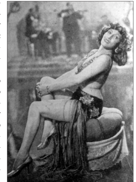
Μια χαρακτηριστική «αποτέτσια» λίγο πριν αρχίσει το νούμερό της.

«Στο έτος 1871, έγιν' έν' άλλο κοσμοϊστορικό γεγονός για το οποίον βούίξε η Παληά Αθήνα. Στο ξύλινο θεατράκι πούταν κοντά στον Διοσό κι' ονομαζότανε "Άντρον των Νυμφών" εμφανίστηκαν στην Πρωτεύουσα κάτι Γερμανίδες Αρτίστες-Μπαλαρίνες. Οι Αθηναίοι τάχασαν