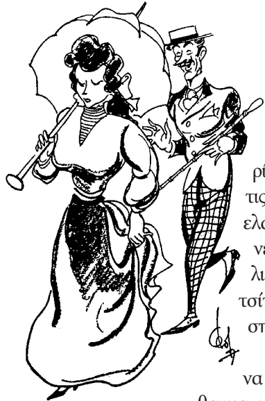
Σου τα 'πε όλα, άκαρδη, Σπλαχνίσου τον!

Μια τέχνη ξέρω: ν' αγαπώ, κι αν θέλεις το καλό σου, να μη διστάσης, κόρη μου: Πάρε με δάσκαλό σου.